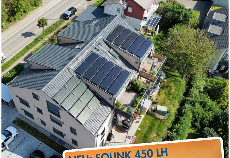
Mehrfamilienhaus mit 6 Wohnungen und einer 17 kW Wärmepumpe bei Freiburg