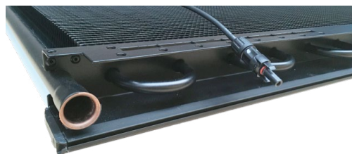
SOLINK - Strom und Wärme aus einem Kollektor/Modul

Der große Luft-Wärmetauscher sorgt im Vergleich zu Standard-PV-Modulen mit und ohne Wärmepumpenbetrieb für eine geringere Modultemperatur. Ein etwa 6 - 10 % höherer Stromertrag und eine reduzierte maximale Modultemperatur führen zu einer langen Lebensdauer. SOLINK ist seit dem Winter 2016/17 erprobt und basiert auf einer Vorläuferentwicklung, die schon seit 2014 im Einsatz ist.